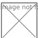
foto: wyróżnieni dyplomami doradcy z regionu łódzkiego pracujący na rzecz

owej w Filharmonii Narodowej w dniu 15 września br.